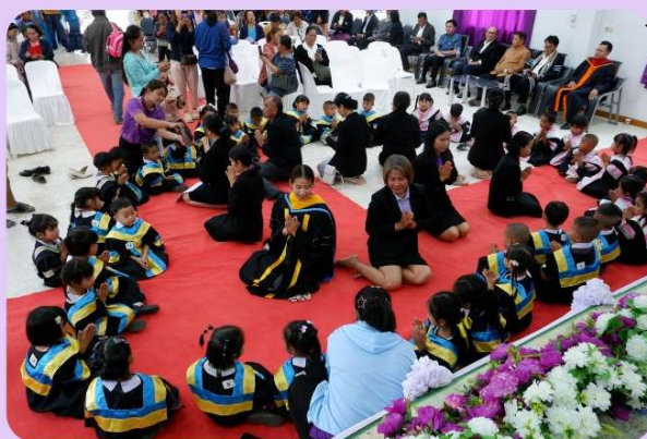
กิจกรรมศูนย์พัฒนาเด็กเล็ก เทศบาลตำบลบ้านชำ

รับบัณฑิตน้อยปี 2568 ศูนย์พัฒนาเด็กเล็กสังกัดเทศบาลตำบลบ้านชำ ขอแสดงความยินดีกับบัณฑิตน้อยทุกคน ที่สำเร็จการศึกษาในระดับปฐมวัยครับ ขอให้หนูๆ มีความสุข สนุกกับการเรียนรู้ในระดับที่สูงขึ้นไป